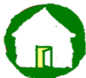
Hauskreise - Treuen